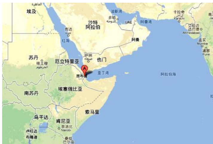
图 1 吉布提地图

吉布提位于东经 41—43 度，北纬 11—13 度，地处非洲东北部亚丁湾西岸，扼红海进入印度洋的要冲——曼德海峡，东南同索马里接壤，北与厄立特里亚为邻，西部、西南及南部与埃塞俄比亚毗连。国土面积 2.32 万平方公里。陆地边界线长 520 公里，海岸线长 372 公里。