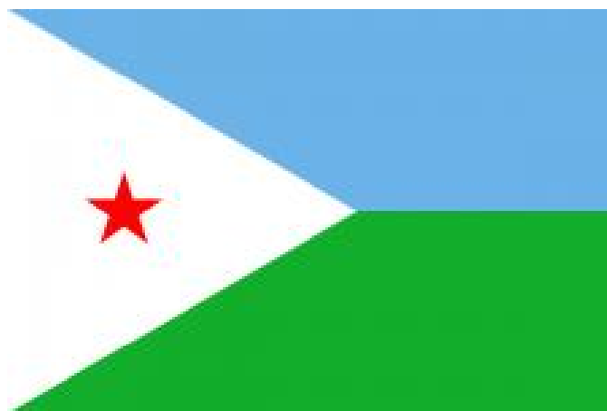
图 2 吉布提国旗

现行宪法于 1992 年 9 月 4 日经全民公决通过并颁布实施。宪法还规定废除死刑。政党必须非种族化、非民族化、非宗教化和非地区化。吉布提实行总统制，总统兼任政府首脑。国民议会是国家最高权力机构，享有立法权。司法机构实行三权分立、司法独立和法官终身制，总统主持的最高法官会议监督法官的工作。